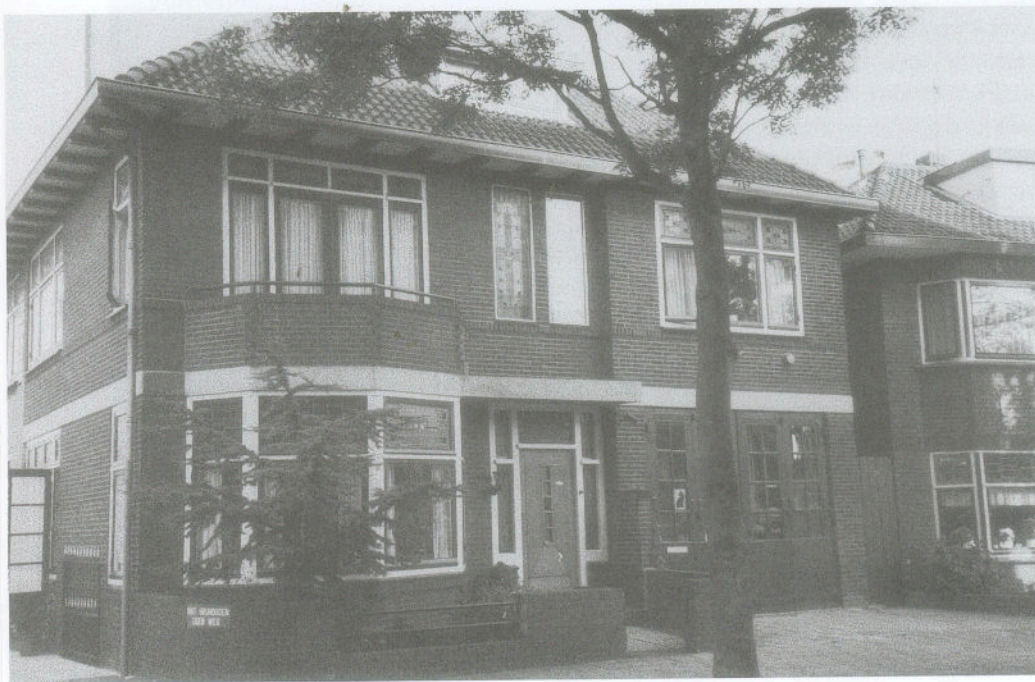
Afb. 7: Het pand Hooftstraat nr. 202, dat W.G. van 't Riet in 1932 liet bouwen; thans klussenbedrijf 'Me Broer' (foto, coll. Hist.Ver. 277-6-6).