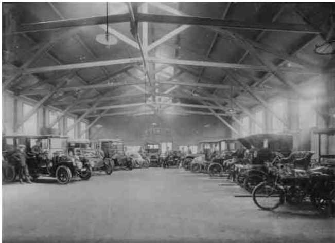
afbeelding 3 Een hal in het Utrechtse pand van Grund, rond 1910. Diverse Renaults zijn te zien maar ook een motorfiets en auto's van andere merken.

Utrecht eveneens gevestigd is aan de Maastrichtse Onze Lieve Vrouwekade 10-11 (afbeelding 4). Naast de import van Renault voegt hij ook die van Berliet en Delage aan zijn portfolio toe.